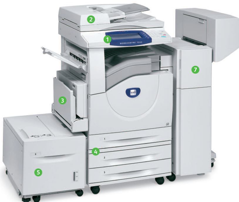
Plate-forme EIP (Extensible Interface Platform™) de Xerox